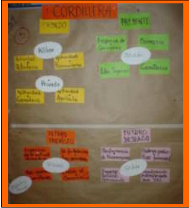
Historia Económica Cordillera, Bolivia