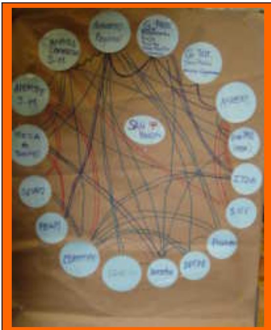
Mapeo de actores Región San Martín