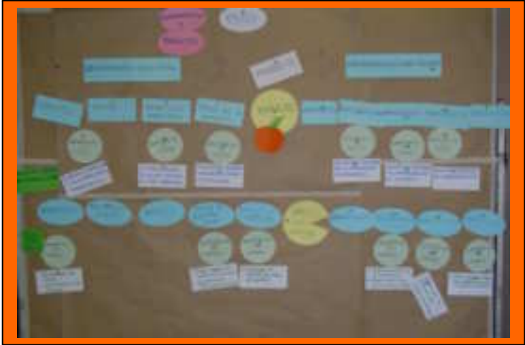
Encadenamientos Taller DEL Bolivia